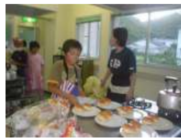
朝食は簡単にできるメニューが多かった。