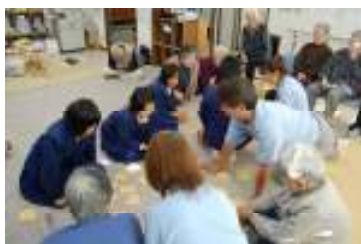
お年寄りとのふれあい