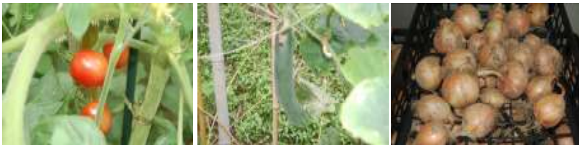
学級園で作った野菜。左からトマト、キュウリ、たまねぎ。