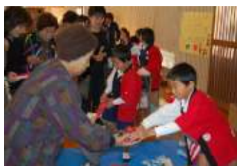
しらさぎフェスタ