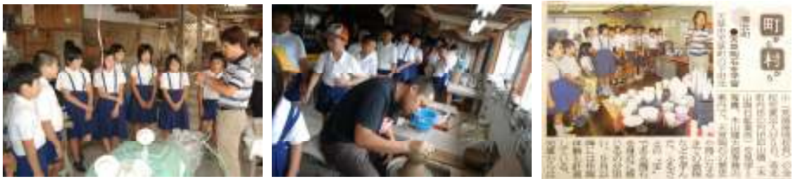
各工程の説明を受けながら見学した。そのときの様子が新聞に掲載された。