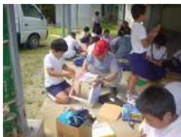
平成18年度から「下田っ子ふれあいデー」を実施。