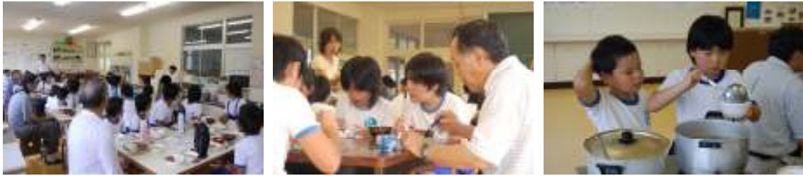
下田っ子ふれあいデーの会食。5・6年生がカレーを作った。