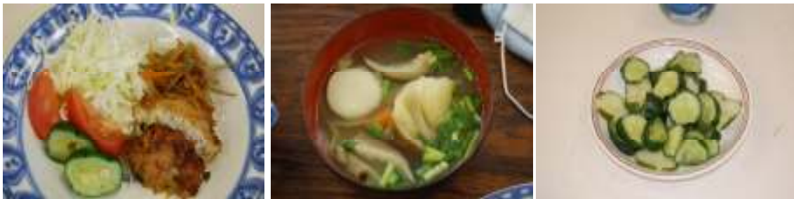
地域の方と作った郷土料理。左からすり身の天ぷら、だご汁、酢の物。