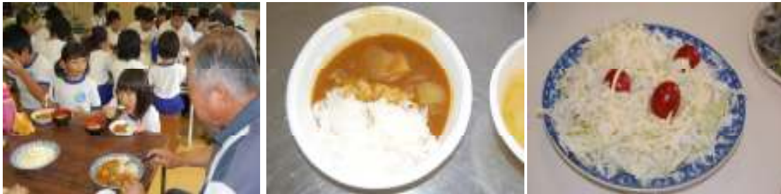
下田っ子ふれあいデーの様子と、そのとき作ったカレーとサラダ。