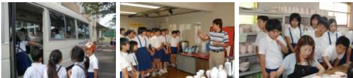
移動はマイクロバス。内田皿山焼の歴史や特徴を説明していただいた。