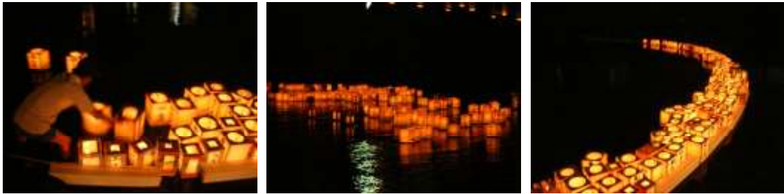
8月に行われた灯籠流しの様子。児童が作った作品もこの日に流した。