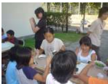
バーベキューでは全て保護者に準備をしていただいた。