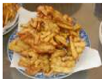
伝統料理「がねあげ」