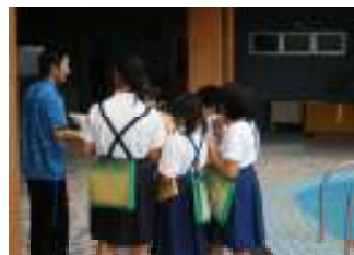
調査活動の様子。旅館や温泉センターで、インタビューやアンケートをとった。