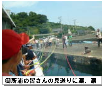
御所浦の皆さんの見送りに涙、涙