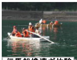
伝馬船櫓漕ぎ体験