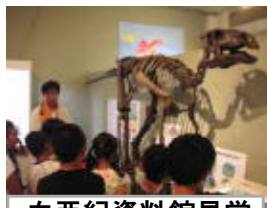
白亜紀資料館見学