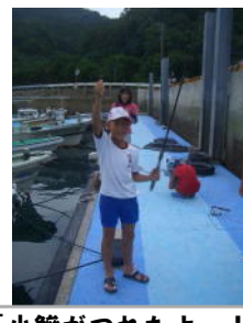
「小鱈がくれたよー！」