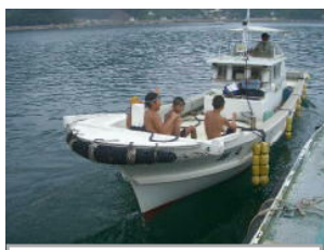
漁船に乗って海水浴へ